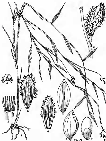
Pl. 3. — Ancistrachne numzensis (Balansa) Blake : 1, port et aspect général; 2, ligule; 3, épillet, vue latérale \times 10 ; 4, glume inférieure, face externe; 5, glume supérieure, face interne; 6, fleur inférieure, lemma et palea; 7, fleur supérieure \sigma^7 à maturité; 8, lemma fertile; 9, caryopse.